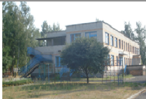
Здание детского сада

Начальная цена продажи - четыре базовые величины.